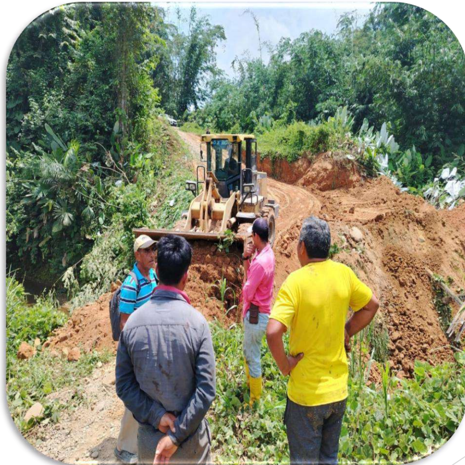
VIA PLAYTIA PALESTINA